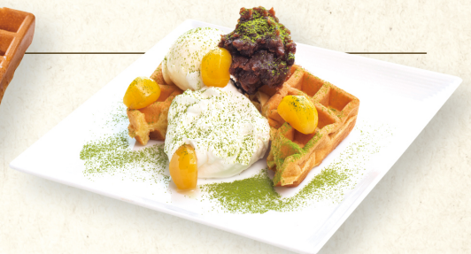
Ogura Matcha Waffle