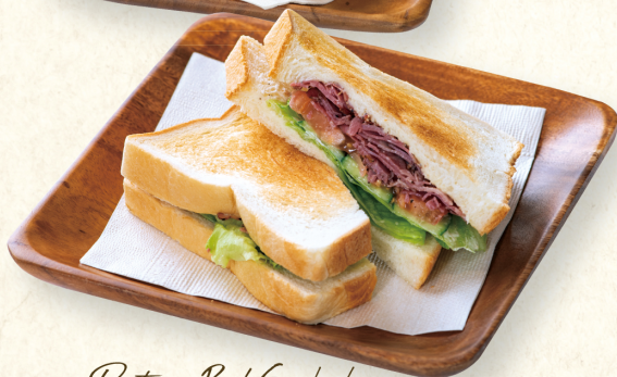
Pastrami Beef Sandwich

パストラミビーフサンドウィッチ ..... ¥700(¥770) 軽くトーストしたパンで パストラミビーフと野菜をサンド。